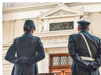
Comisión técnica por ley corta fija deuda de las isapres en US$ 451 millones, menos de un tercio del cálculo de la