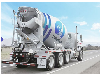
Cemento Polpaico aplica duro ajuste ante contracción del sector: cierra dos plantas y