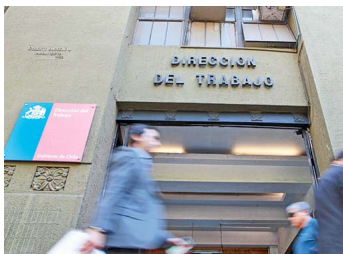
La disputa interna que llevará al titular de la Dirección del Trabajo a tribunales | Diario Financiero