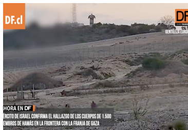
Ahora en DF | Israel confirma el hallazgo de los cuerpos de 1.500 miembros de Hamás | Diario Financiero