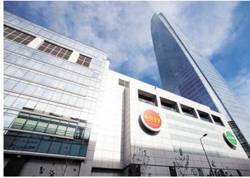
Regulador chileno sanciona a CEO de Cencosud por usar información privilegiada para adquirir acciones de la compañía | Diario Financiero