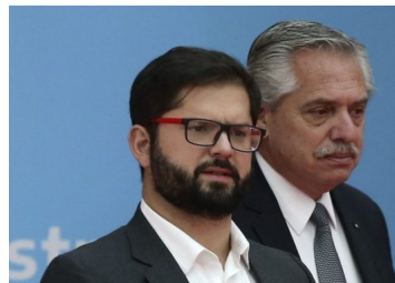
La molestia por la exclusión del Mundial 2030 llegó hasta La Moneda: Presidente Boric llamó a su par argentino Alberto Fernández | Diario Financiero