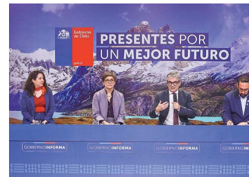
Gremio de la construcción valora incentivos tributarios anunciados por el Gobierno para compra de viviendas | Diario Financiero