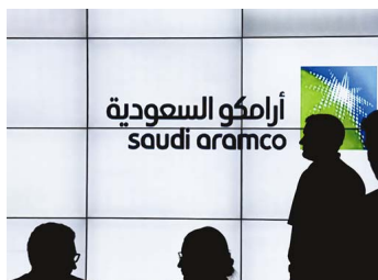
Arauco se opone al registro de la marca Aramco en Chile: “Se generará confusión” | Diario Financiero