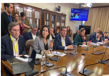
AFP responden al Congreso en medio de debate previsional: "Si las pensiones son bajas no es por las AFP" | Diario Financiero