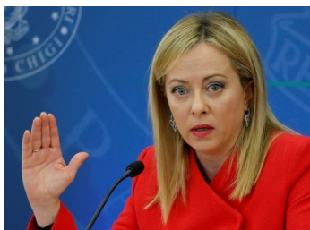
Italia golpea a los bancos con un impuesto inesperado | Diario Financiero