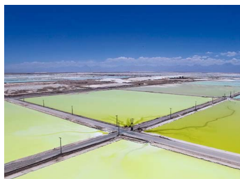
Toma fuerza idea de declarar el litio como concesible y senadores se aprestan a elaborar propuesta | Diario Financiero