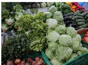
IPC sube en julio sobre las estimaciones del mercado impulsado por alza de alimentos y bebidas | Diario Financiero