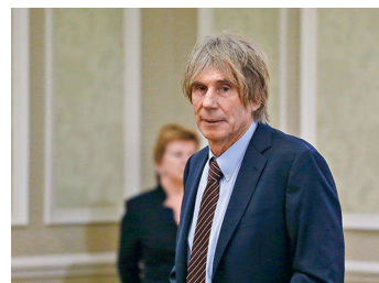
Büchi y los 50 años: "Se hicieron políticas que cambiaron a Chile, le guste o no a algunos reconocerlo, pasar de un país pobre a uno próspero" | Diario