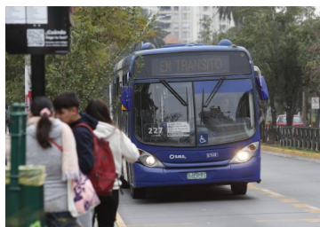
¿Cuánto presionará el alza en el transporte público al IPC? | Diario Financiero