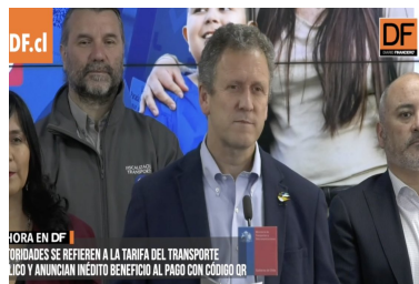
Ahora en DF | Ministro de Transportes anuncia aumento de la tarifa del transporte público | Diario Financiero