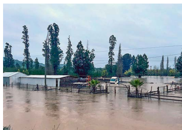
Escalan efectos del temporal en el sector privado: a daños en predios de frutales se suma la detención de plantas de Arauco | Diario Financiero