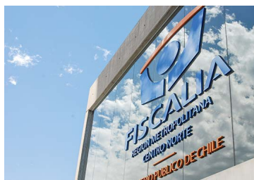
Fiscalía inicia implementación de nueva norma de delitos económicos: "Para que esta ley no quede en el papel" | Diario Financiero