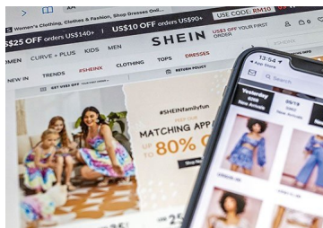
H&M demanda a Shein por infracción de derechos de autor | Diario Financiero