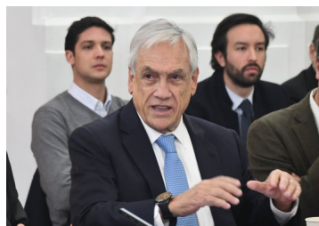
Piñera entra al debate sobre Jackson: “Un Presidente tiene que pensar en el interés común y no incorporar consideraciones personales” | Diario