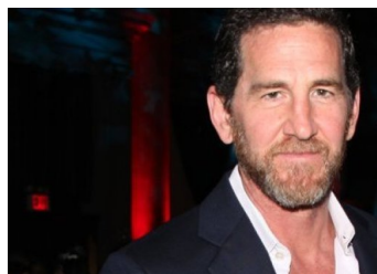
Socio de Goldman acuerda millonario pago para