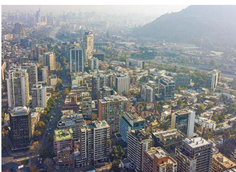
Providencia: Precios de arriendo caen 20% y las