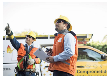
Sernac llega a acuerdo con CGE para indemnizar a clientes por cortes de luz por lluvias en el verano