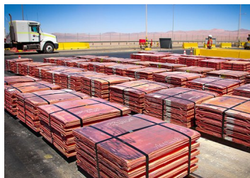
Actividad de la construcción explica el 22% de la demanda de cobre por parte de China