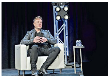
Bitcoin cae más de 9% luego que Elon Musk dejara