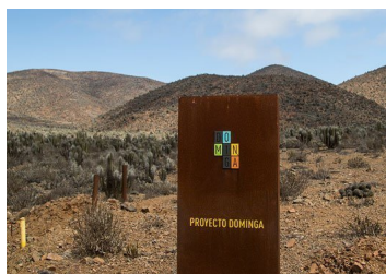
Opositores a proyecto Dominga presentan recursos ante la Corte Suprema para revertir sentencia del Tribunal Ambiental