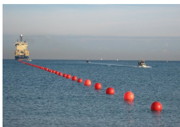
Brasil se une a Chile en construcción de primer cable de fibra óptica entre Sudamérica y Asia