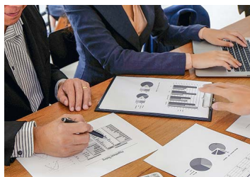
Empresas se preparan para el desafío constituyente con