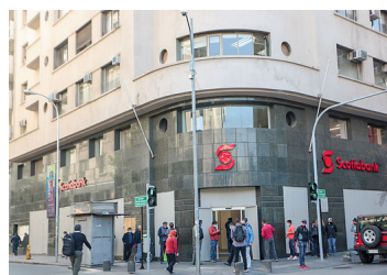
Scotiabank indemnizará a clientes con $ 20 mil millones