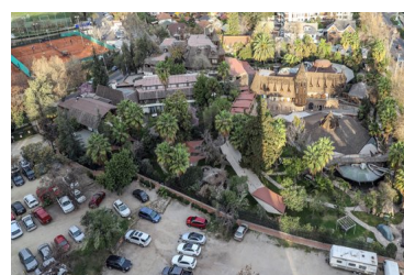
Dueños de proyecto inmobiliario en el ex Hotel Manquehue afirman que no