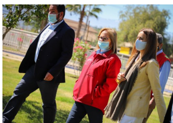
Comité de ministros aprueba plan de