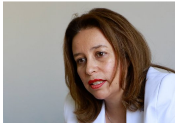
Senado aprueba en general reforma a Ley de Servicios Sanitarios