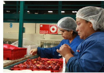
Cámara de Diputados aprobó proyecto que garantiza un ingreso mínimo de $ 300 mil líquidos