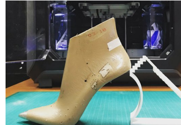
Guante y Gacel apuesta por la tecnología para darle una segunda vida a la firma