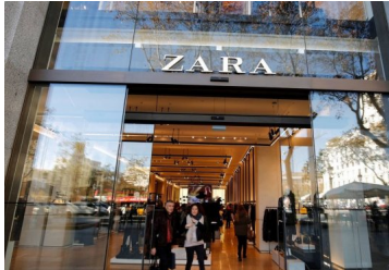
Matriz de Zara imbatible: más ventas, reducción de stock e implementación de tienda online global consolidan su modelo