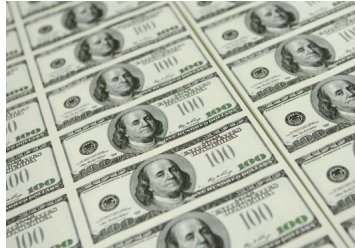
Dólar parte el día sin grandes variaciones a la espera de la Fed y guerra comercial