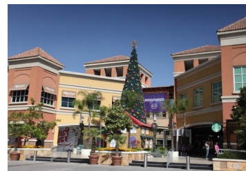
Comercio reporta fuerte caída en noviembre y espera que ventas del retail cierren el año con una contracción de hasta 5%