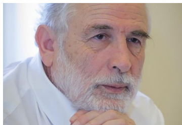
Montes: “Se requiere una reforma tributaria de mayor envergadura, eso está claro”