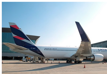
Previo a los resultados de la OPA de Latam: Grupo Bethia aprobó vender 50% o más de sus acciones en la aerolínea